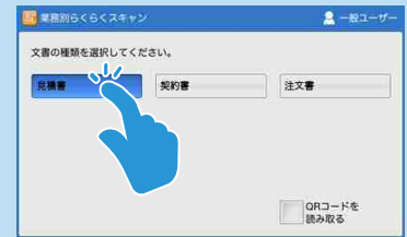
スキャンする定型文書をボタンから選ぶ